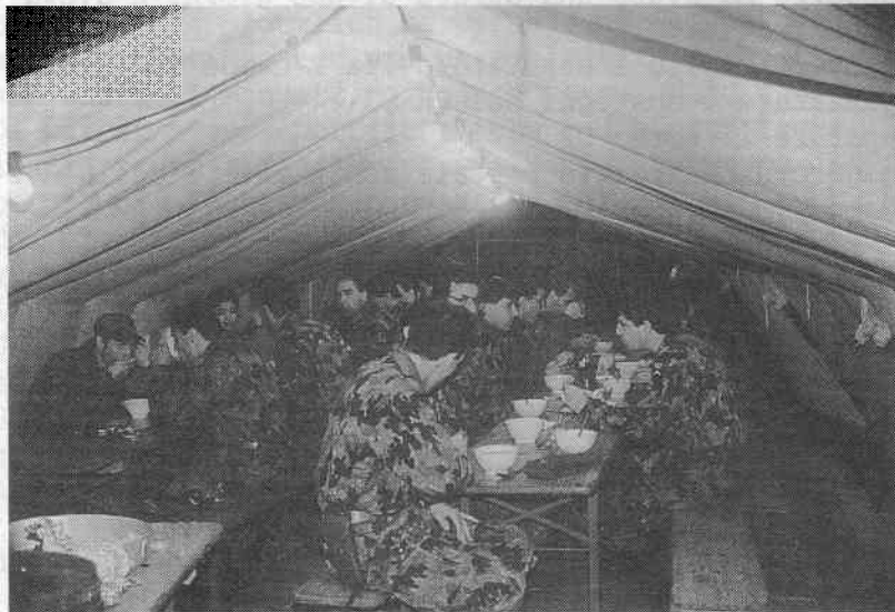
P campo 101 a colazione

Il grosso della truppa è entrato in servizio a scaglioni per un esercizio di mobilitazione. Le nostre conoscenze teoriche sono subito state messe a dura prova, poichè da martedì a giovedì abbiamo servito la truppa sulle PSB.